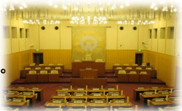
【入間市議会本会議場】