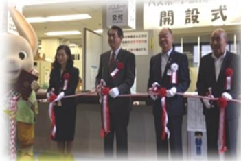
【パスポート窓口開設式】

身近な市役所に 両窓口が開設したことで、利便性が向上が図られました。 是非ご利用ください！