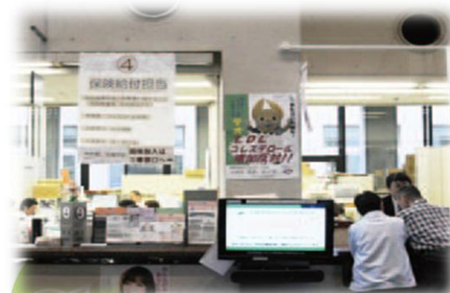
【市役所1F健康年金課窓口】